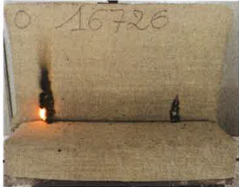
Il secondo innesco sulla provetta campione 2