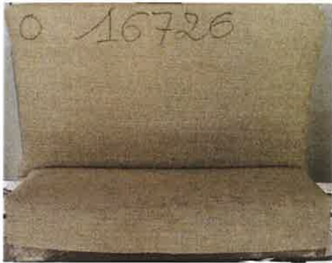
La provetta prima della prova campione 2