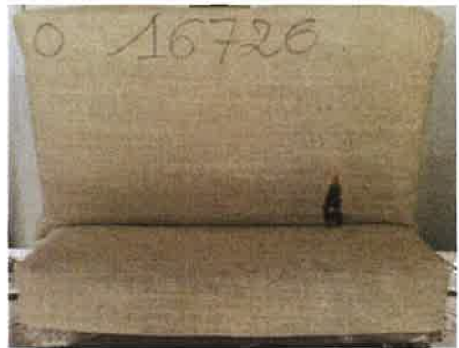
Il primo innesco sulla provetta campione 2