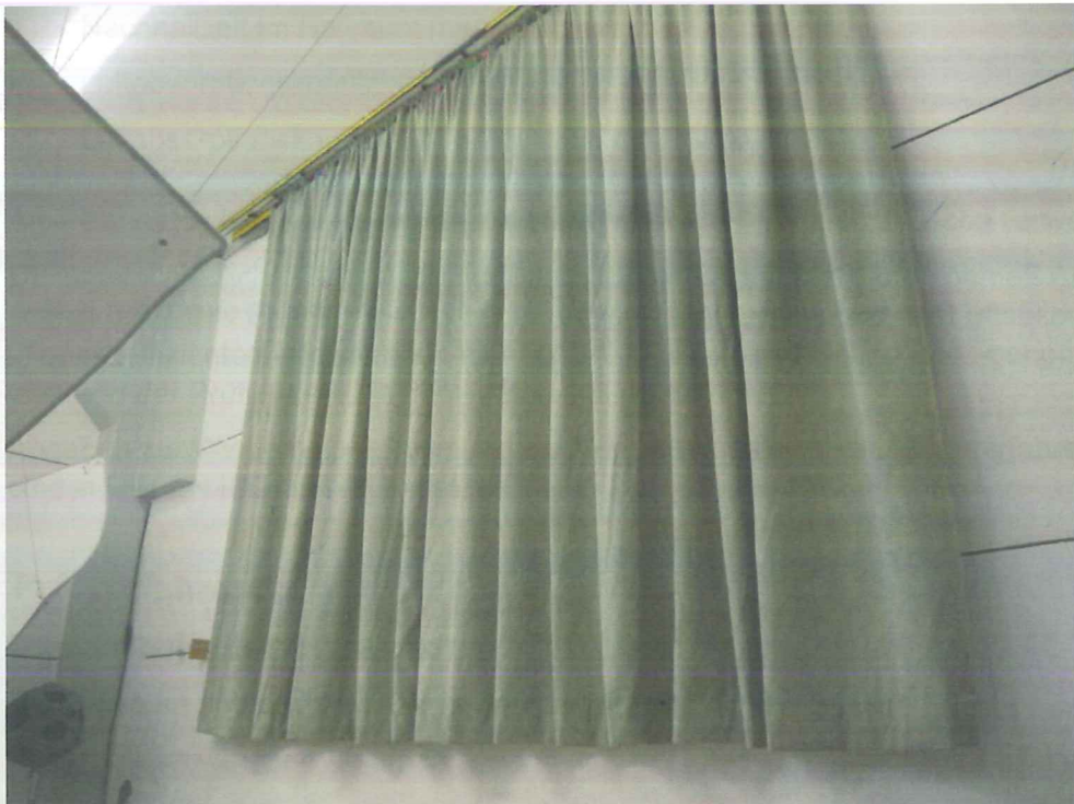
Abbildung B.2. Prüfanordnung im Hallraum (Schrägsicht)