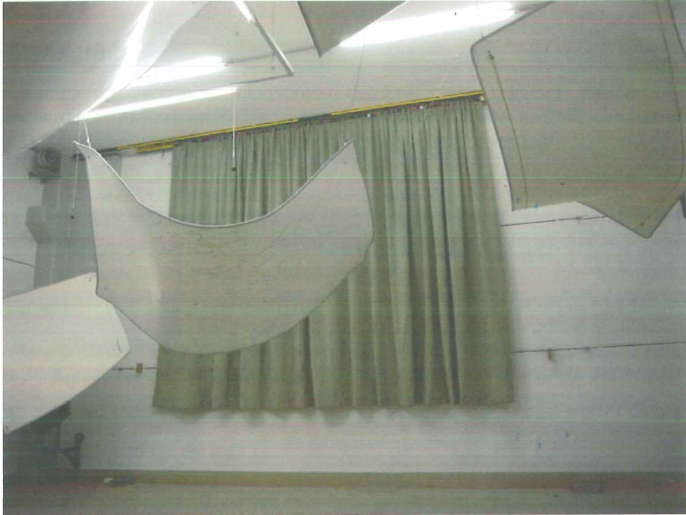
Abbildung B.1. Prüfanordnung im Hallraum (Ansicht)