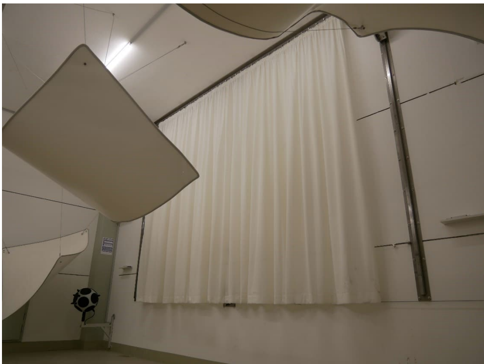
Abbildung B.2. Geraffte Prüfanordnung im Hallraum (diagonale Ansicht).