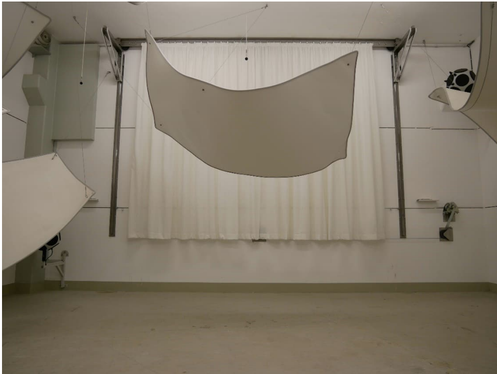
Abbildung B.1. Geraffte Prüfanordnung im Hallraum (frontale Ansicht).