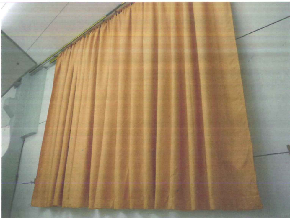
Abbildung B.2. Prüfanordnung im Hallraum (Schrägansicht)