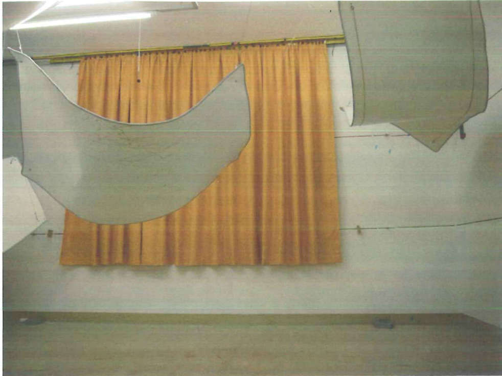
Abbildung B.1. Prüfanordnung im Hallraum (Ansicht)