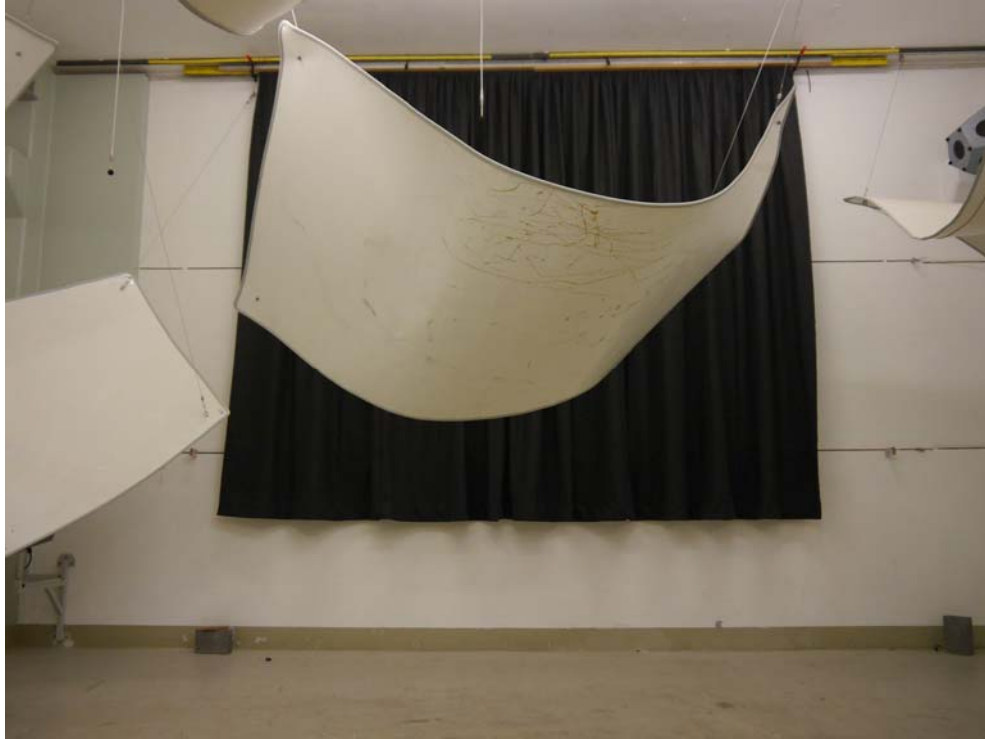
Abbildung B.1. Prüfanordnung im Hallraum (Ansicht).