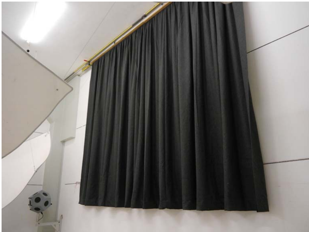
Abbildung B.2. Prüfanordnung im Hallraum (Schrägsicht).