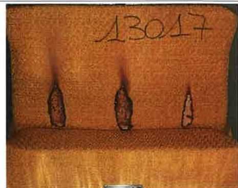
Campione 2 Il terzo innesco sulla provetta

NOTE: ATTENZIONE PROVA NON UTILIZZABILE AI FINI DELL'OMOLOGAZIONE