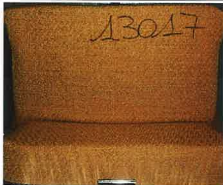
Campione 2 La provetta prima della prova