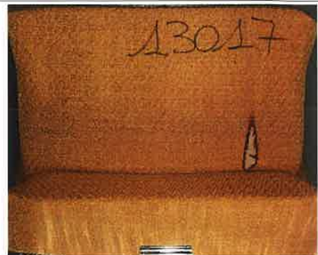
Campione 2 Il primo innesco sulla provetta