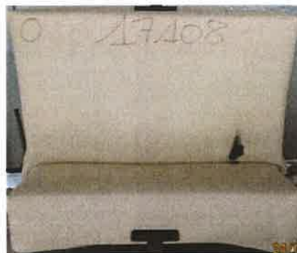
Il primo innesco sulla provetta campiono 2