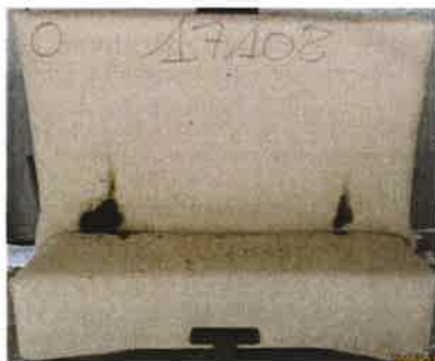
Il secondo innesco sulla provetta campiono 2