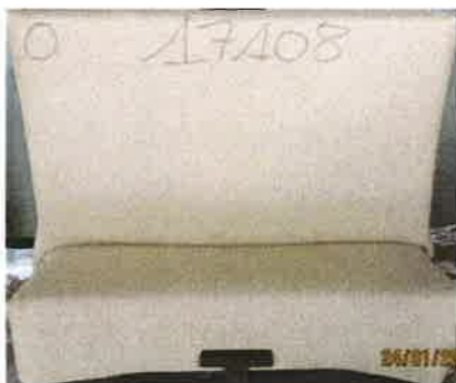
La provetta prima della prova campiono 2