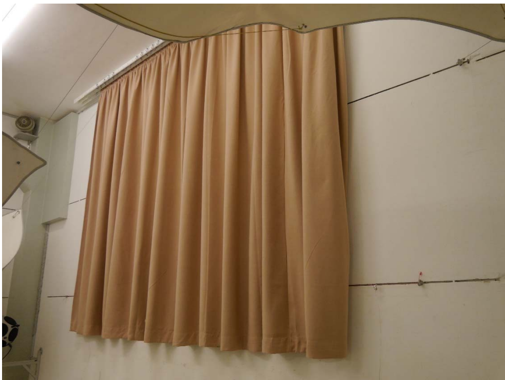
Abbildung B.2. Prüfobjekt im Hallraum: Schrägansicht.

\\s-muc-fs01\allefirmen\MI\Proj\076\M76176\M76176_46_PBE_1D.DOCX : 14.10.2020