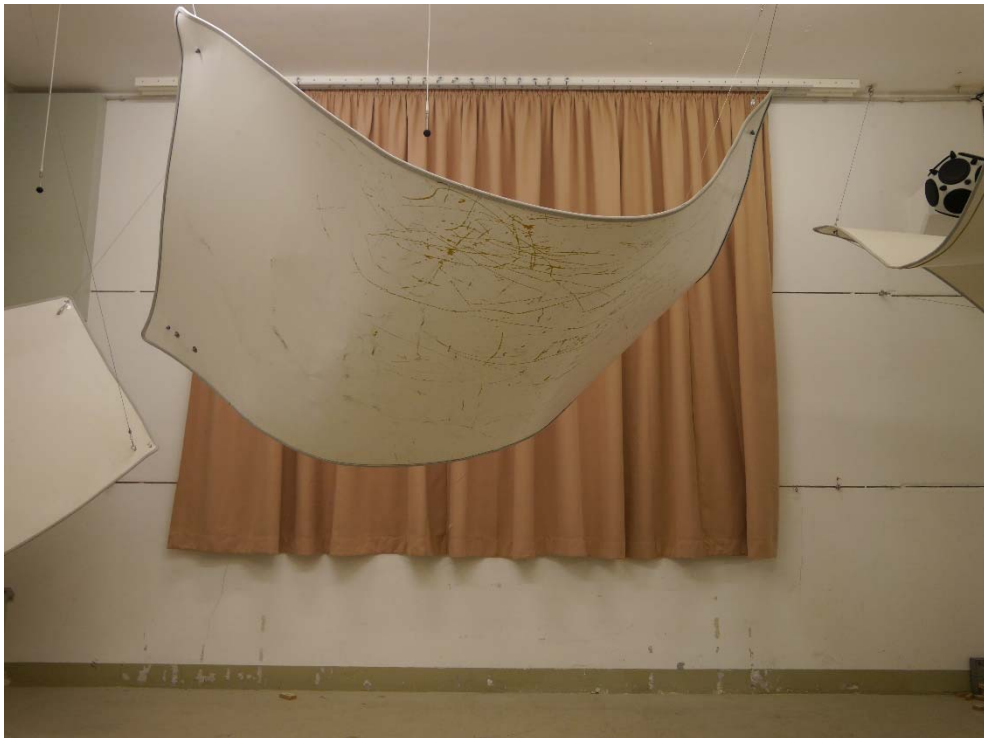
Abbildung B.1. Prüfobjekt im Hallraum: Frontalansicht.